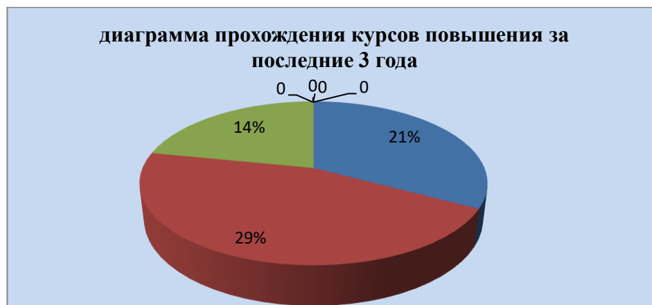
диаграмма прохождения курсов повышения за последние 3 года