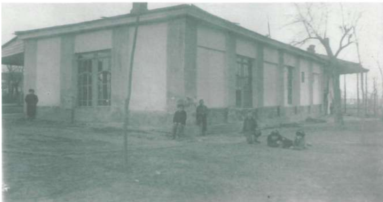
Первое здание Дома пионеров располагалось в городском парке с 1952 по 1970 гг.