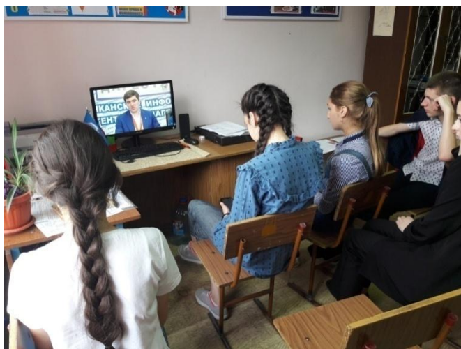
Практикум корреспондентов, посвященный чувствованию чемпиона